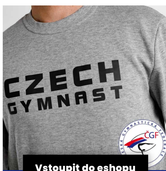
Vstoupit do eshopu

I rok 2022 bude nabitý a to mnoha akcemi, jejichž data můžete vidět na webu nebo proklikem přímo zde . Akce budeme postupně doplňovat!